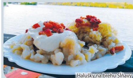
Halušky na brehu Sĺňavy