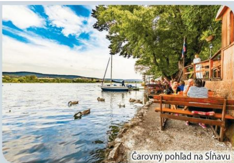
Čarovný pohľad na Sĺňavu

Letná terasa s výhľadom na hladinu jazera a panorámu Považského Inovca sa nachádza pri Lodenici v Piešťanoch, priamo na cyklotrase okolo Sĺňavy. Zákazníci sa radi zastavia na ze-